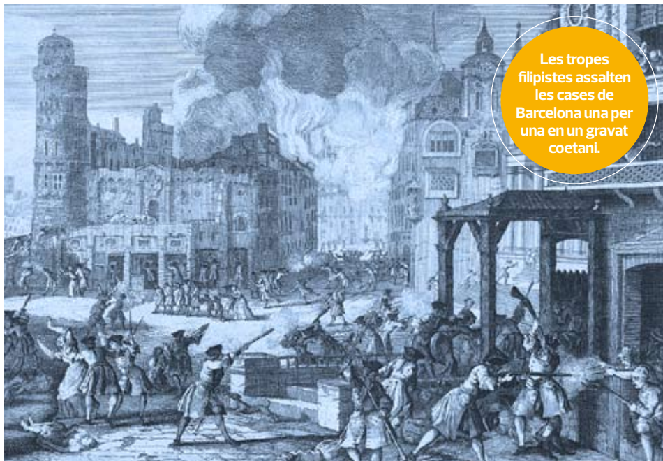
Les tropes filipistes assalten les cases de Barcelona una per una en un gravat coetani.

Sí, certament: tot passa, o tot ho fa passar l'autor, a començament del segle XVIII. Les circumstàncies històriques són, per a Barcelona i per al país, molt més bròfegues que les actuals. Llegint l'obra, no podem deixar de pensar en Perucho, gran admirador del Segle de les Llums. Però és que la història serveix a Carrió per revelar amb uns colors intensos allò que no canvia: la fragilitat de l'existència humana, la convivència entre misèria i grande-