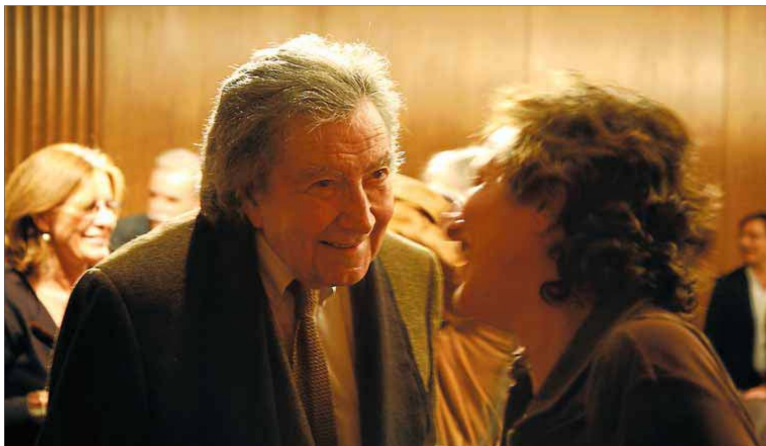
Un somrient Antoni Tàpies en l'acte de presentació del llibre de poemes de Jordi Carrió el passat 5 de novembre

Els llibres es relacionen amb Tàpies de moltes maneres: n'ha llegit moltíssims; també n'ha escrit, sobre ell i sobre la seva obra i sobre l'art en general ( La pràctica de l'art , 1970; La realitat com a art , 1982); n'ha il·lustrat, amb Brossa o amb d'altres poetes; n'ha col·leccionat i n'ha integrat en les seves obres ( Rentamans i llibres , 1987; Llibre i coberts , 1996). Per Tàpies, un llibre no és només un element de lectura sinó que alhora té un sentit estètic en si mateix. Ell ha unit les dues arts, poesia i pintura, i s'ha format sobretot gràcies a la lectura i durant un temps a través dels llibres que arribaven d'Europa clandestinament i aquesta era gairebé l'única manera de conèixer el que realment estava passant al món. Aquells anys 50 són claus en